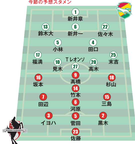
今節の予想スタメン

熊本としては、試合開始早々に先制点を奪って優位な展開で進めることができた前節と同じように、入りから積極的にプレッシャーをかけ、自分たちの流れに持ち込んで先制したいところ。ただ、千葉はリーグで2番目に少ない失点15と守備は堅いため、焦れずにボールを動かしながらチャンスをできるだけ多く作ることも意識したい。合わせて、セットプレーも含めてゴール前では集中を切らさず粘り強く対応することが必要。無失点に抑えて連勝に結べるか、大事な一戦だ。