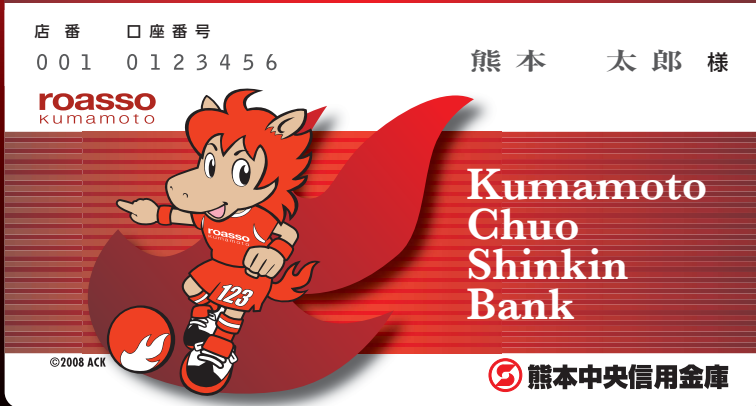
定期性総合口座通帳