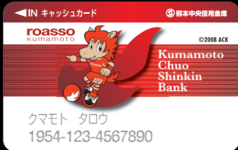
キャッシュカード